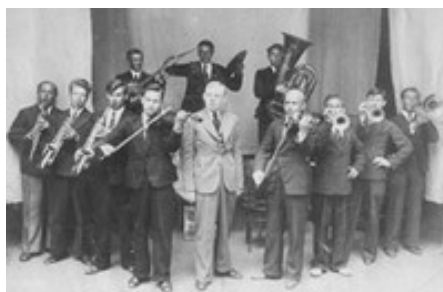
Первый в РСФСР эксцентрический оркестр — джаз-банд Валентина Парнаха

Итак, перейдем непосредственно к хронологии. Джаз-сцена зарождается в СССР в 20-е годы одновременно с её расцветом в США. Как правило, историки джаза ведут отсчет советского джаза с приезда в Россию Валентина Яковлевича Парнаха (15 июля 1891, Таганрог — 29 января 1951, Москва).